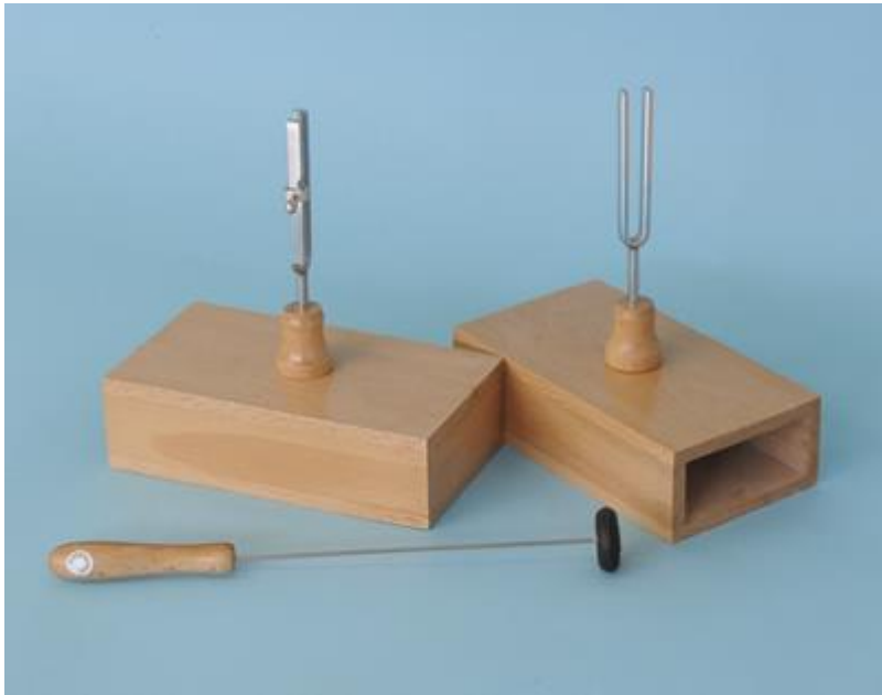
PAR DE DIAPASONES CON CAJA PAIR OF TUNING FORKS WITH BOX