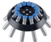
Rotor angulaire | GNM008 15 mL×12 6000 rpm / 5150 ×g