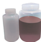
Ballon en PP | GNQ001 Fond plat 250 mL 4000 rpm/3100 ×g Pour les références GNP020 et GNP027