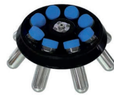
Rotor angulaire | GNP034 50 mL×8 6000 rpm / 5150 ×g