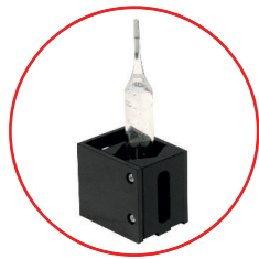
Porte-tubes à essai Diámetro : Ø 13 - 16 mm Hauteur : 45 - 110 mm