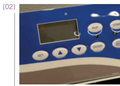
Détail du panel de contrôle