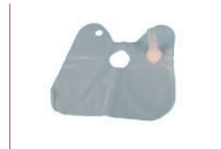
b| Vía respiratoria desechable