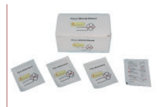
c| Caja de aplicaciones higiénicas