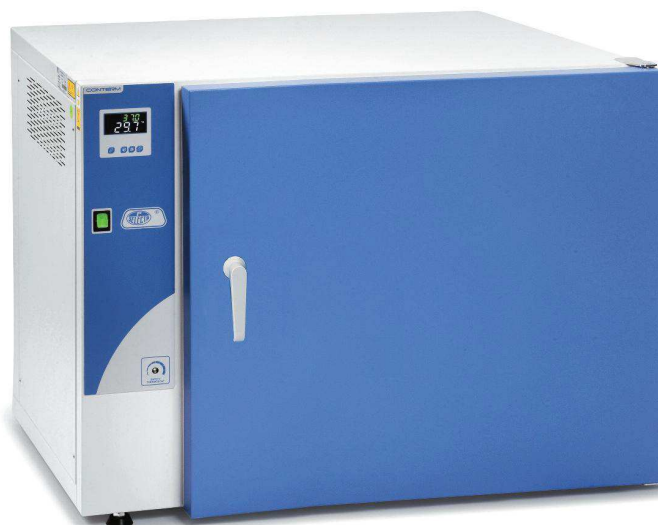
Modèle Conterm type Poupinel, codes 2000252 et 2000254.