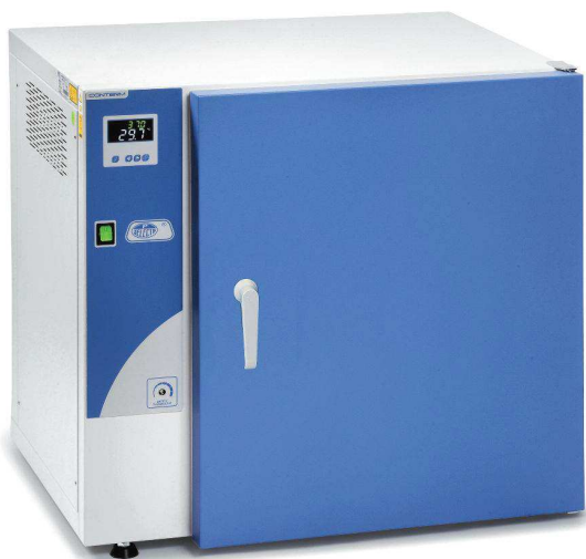
Modèles Conterm, codes 2000250, 2000251 et 2000253.

CARACTÉRISTIQUES, PANNEAU DE COMMANDES, SÉCURITÉ, NORMES ET ACCESSOIRES (voir pages 138 et 139).