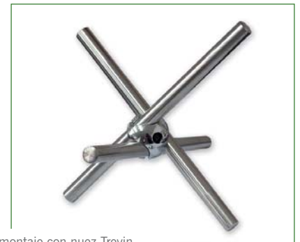
Ejemplo montaje con nuez Trevin