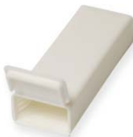
Ref. | Code: 40305050