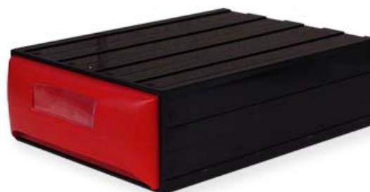
Ref. | Code: 43510011