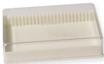
Ref. | Code: 40305250

Made of plastic and with different capacities. The highest capacity boxes (50 and 100 slides) can be stacked with security, and present an easy-to-open plastic clasp at the front.