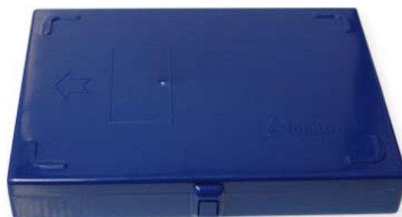
Ref. | Code: 40305450