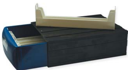
Ref. | Code: 43510010

Stackable and very stable, allows the storage of up to 450 slides. Made of plastic.