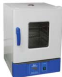
[02] Ref. JBB001 Capacidad: 30 L