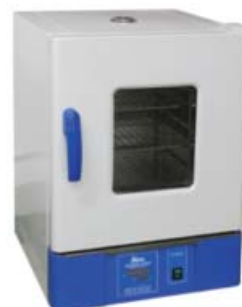
[03] Ref. JBB002 Capacidad: 45 L