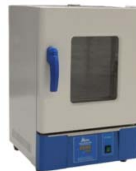
[04] Ref. JBB003 Capacidad: 65 L