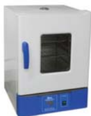
[01] Ref. JBB005 Capacidad: 15 L