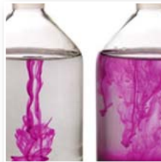
[08] Agua y disolventes