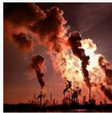
[07] Polución atmosférica