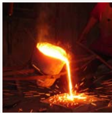
[06] Ind. metalúrgica